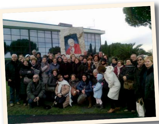
Novembre 2013, pellegrinaggio proveniente da Triggiano, diocesi di Bari

zione per l'ingresso al Santuario, per cui in quel momento visto il permanere del traffico intenso, decisi di svoltare verso il Santuario. Ci ritrovammo in un mare di macchine in sosta nei pressi di una nuova grande moderna chiesa. Decidemmo di fermarci anche noi in attesa che il traffico diminuisse. Ci guardammo intorno per ammirare i prati verdeggianti pieni già di persone di tutte le età che passeggiavano e giocavano, quindi entrammo in chiesa (Nuovo Santuario). Pur colpito dalla vastità e dalle bellissime vetrate della chiesa, il quadro della Madonna appeso sull'altare non mi ricordava esattamente quello visto tanti anni prima in quella che era una chiesa molto più piccola. Uscito, notai la Torre del Primo Miracolo e da lì la vecchia chiesa con il piccolo campanile e coinvolgendo la mia famiglia nei miei ricordi del Santuario degli anni '60-'70 entrammo nell'antico Santuario, dove pur nelle sue varie ristrutturazioni e restauri, l'altare era rimasto identico con gli angeloni che sostengono il quadro miracoloso della Madonna del Divino Amore.