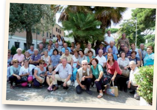
Settembre 2013: il gruppo ANMIL - Associazione Nazionale Mutilati ed Invalidi del Lavoro Sezione di Dolo (VE) in visita al Divino Amore, ha soggiornato presso la Casa del Pellegrino