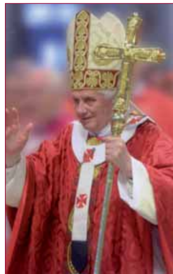
Benedetto XVI Papa Emerito

spaventosa di abbandono, e ciò che della morte ci fa più paura è proprio questo, come da bambini abbiamo paura di stare da soli nel buio e solo la presenza di una persona che ci ama ci può rassicurare. Ecco, proprio questo è accaduto nel Sabato Santo: nel regno della morte è risuonata la voce di Dio. È successo l'impensabile: che cioè l'Amore è penetrato "negli inferi": anche nel buio estremo della solitudine umana più assoluta noi possiamo ascoltare una voce che ci chiama e trovare una mano che ci prende e ci conduce fuori. ( Liberalmente tratta dalle parole di Benedetto XVI in visita alla Sindone - Torino 5/5/2010 )