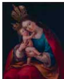
Santa Maria Ausiliatrice di Brezje donata per la Rassegna Mariana