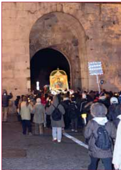
Riapertura del pellegrinaggio notturno

Tratto dalle parole di Giovanni Paolo II