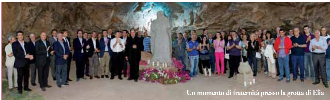
Un momento di fraternità presso la grotta di Elia