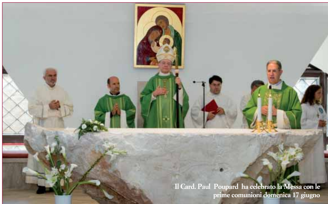
Il Card. Paul Poupard ha celebrato la Messa con le prime comunioni domenica 17 giugno

Ora possiamo dire che la nostra comunità parrocchiale ha una sua chiesa, con l'aiuto di Dio e dei benefattori che