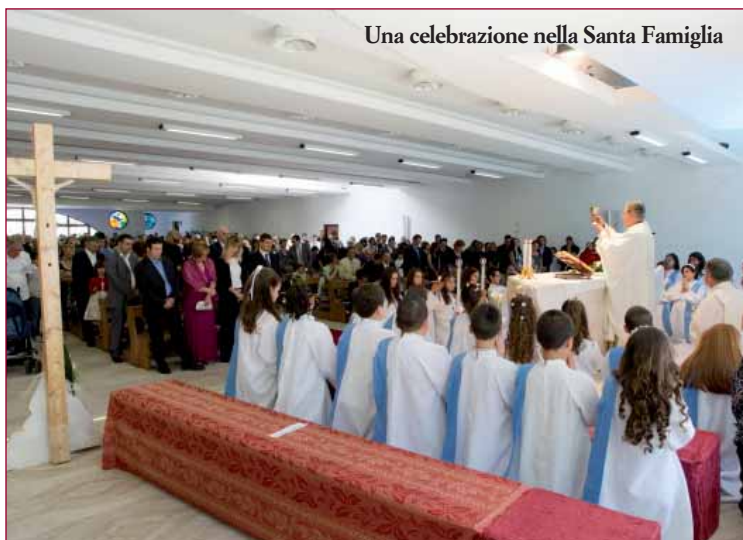
Una celebrazione nella Santa Famiglia

Siamo consapevoli che questo evento non è il solo traguardo prefisso dalla parrocchia, anzi sappiamo che la stessa chiesa necessita ancora di alcune realtà da sistemare definitivamente, come: il Tabernacolo, il Fonte Battesimale, le Vetrate colorate, l'Acquasantiera, il Con-