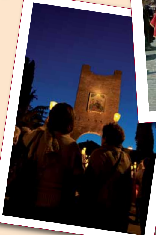
Fiaccolata al Sanuario per la chiusura del mese Mariano