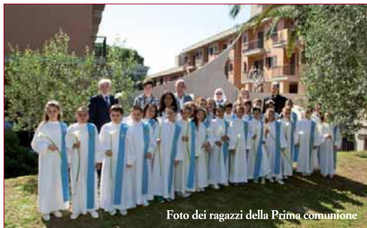
Foto dei ragazzi della Prima comunione

fessionale, l'impianto di illuminazione e i banchi.