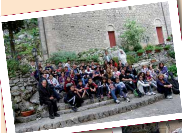
I ragazzi delle cresime del Santuario del Divino Amore a Guarcino