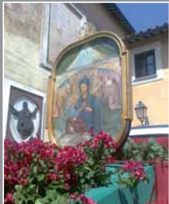
In copertina: Immagine che accompagna le processioni e i pellegrinaggi