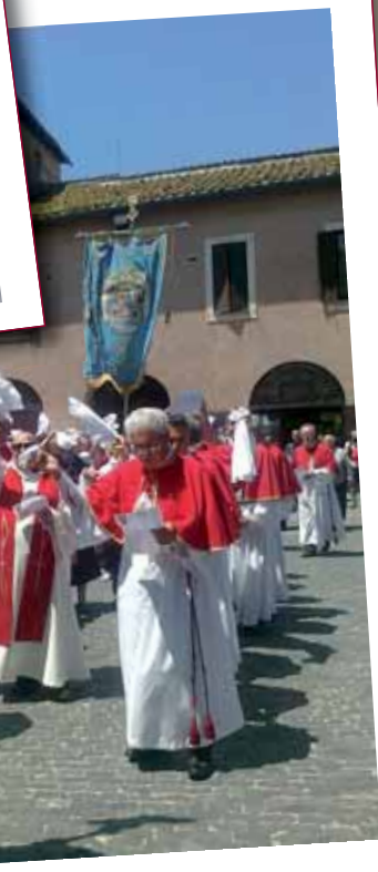
Il Saluto dei pellegrini di Carchitti: senza voltare le spalle alla Madonna, cantando, la salutano con uno sventolio di fazzoletti