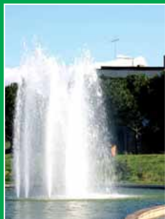
In copertina: Fontana del laghetto presso il nuovo Santuario

Nell'insegnamento di Gesù il Regno dei Cieli è simile a un padrone che esce di casa per cercare operai. L'opera del padrone comincia con le prime luci dell'aurora, prosegue alle nove del mattino, a mezzogiorno, alle tre, alle cinque del pomeriggio. Esce per prendere dei lavoratori; non va alla ricerca di chiunque, ma soltanto di coloro che sono idonei a diventare suoi operai nell'edificazione del Regno. Uomini disposti alla fatica, gente che non fugge la sofferenza, che non cerca continuamente la via più breve o le soluzioni più semplici e meno impegnative. Nello stesso versetto si dice che il padrone uscì per prendere lavoratori "a giornata". Questa espressione allude al fatto che collaborare col Dio vivente significa accettare di lasciare il domani nelle sue mani. Con Lui si lavora sempre "a giornata", Egli