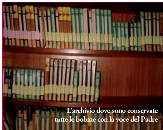
L'archivio dove sono conservate tutte le bobine con la voce del Padre