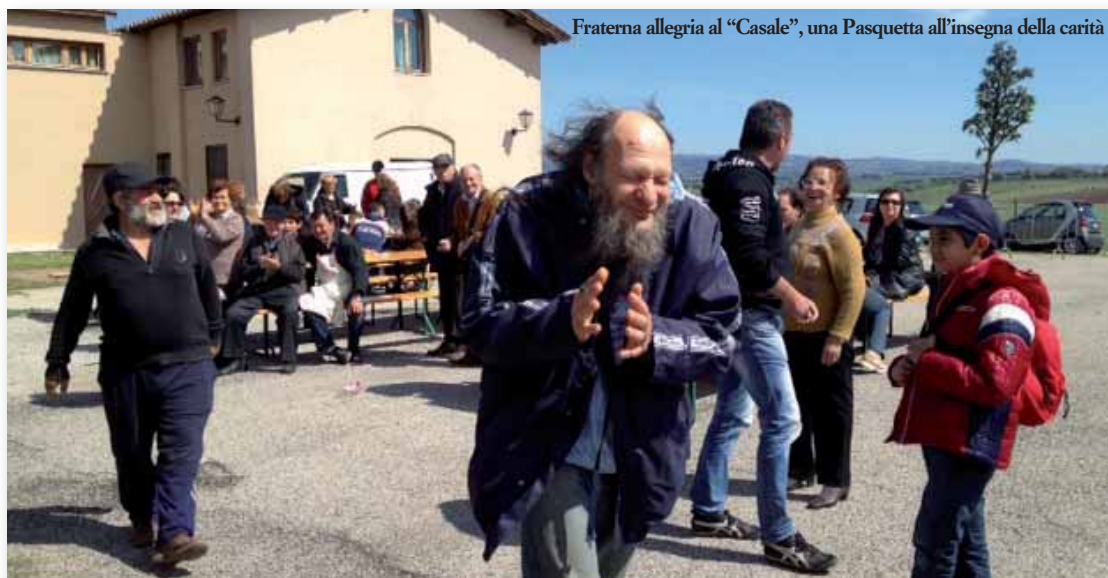
Fraterna allegria al "Casale", una Pasquetta all'insegna della carità