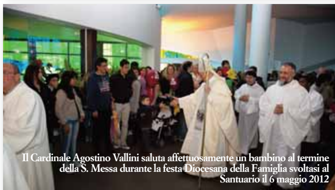
Il Cardinale Agostino Vallini saluta affettuosamente un bambino al termine della S. Messa durante la festa Diocesana della Famiglia svoltasi al Santuario il 6 maggio 2012