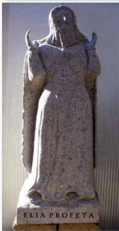
La statua in peperino del Profeta Elia riposizionata nell'omonima Grotta in occasione della chiusura del mese di maggio