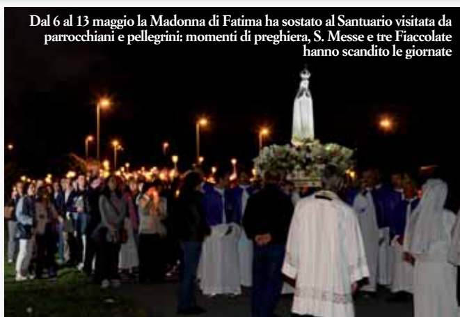
Dal 6 al 13 maggio la Madonna di Fatima ha sostato al Santuario visitata da parrochiani e pellegrini: momenti di preghiera, S. Messe e tre Fiaccolate hanno scandito le giornate