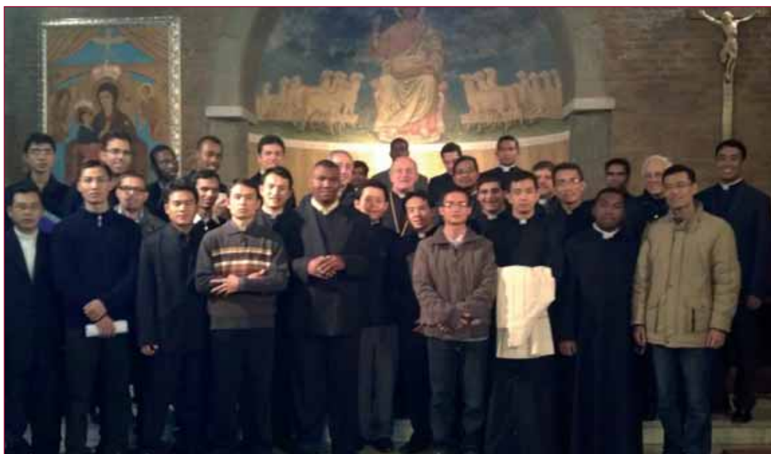
Il Seminario della Madonna del Divino Amore all'apertura dell'Anno Accademico dell'Università Lateranense