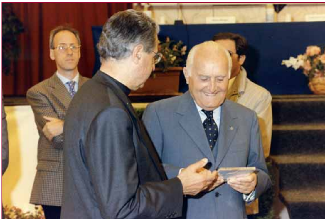
Una pausa durante i lavori del Convegno di preparazione al Giubileo 2000 che si tenne al Divino Amore

Ben arrivata fra noi; ben arrivata annunziata di pace. Ti aspettavamo, Mamma; ti aspettavamo fra un peccato e l'altro, fra una preghiera e un abbandono, fra un atto di fede e un tradimento... Credevamo che riempiendo le mani di cose materiali anche secondo giustizia, automati-