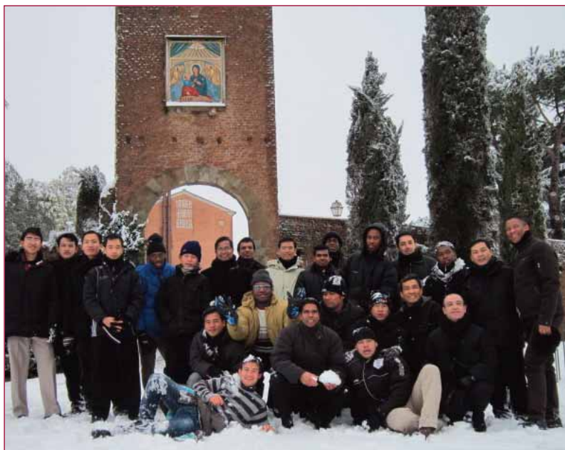
Sulla neve al Divino Amore

è solo un'allegoria; allegoricamente anche la nostra vita sarebbe una liturgia, ma, al