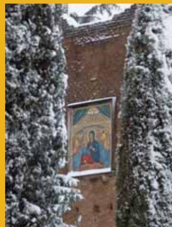
In copertina: Mosaico posto sulla Torre del Primo Miracolo