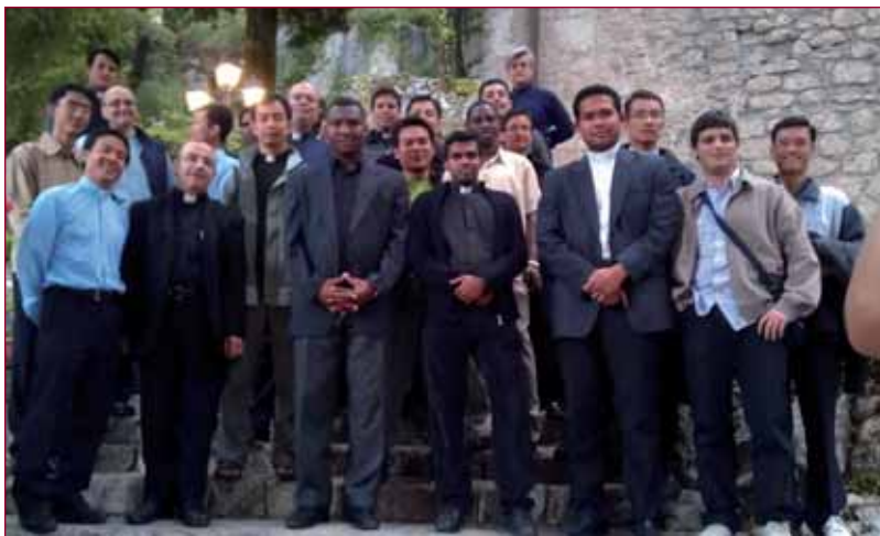
I Seminaristi a Guarcino

All'inizio della sua meditazione ha notato che "anche oggi si parla molto della Chiesa di Roma, di tante cose, speriamo che si parli anche della nostra fede, della fede esemplare della Chiesa di Roma e preghiamo il Signore, perché possiamo fare così che si parli non di tante cose, ma si parli della fede della Chiesa di Roma". Il Papa, proseguendo la sua riflessione, ha spiegato che cosa intende Paolo quando esorta i romani ad "offrire i vostri corpi come sacrificio vivente, santo e gradito a Dio" (v. 1). Dice il Papa "offrire i vostri corpi": parla della liturgia, parla di Dio, della priorità di Dio, ma non parla di liturgia come cerimonia, parla di liturgia come vita. Noi stessi, il nostro corpo; noi nel nostro corpo e come corpo dobbiamo essere liturgia. Questa è la novità del