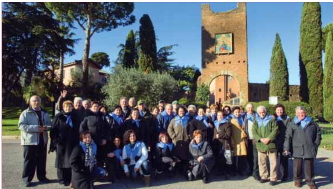
Pellegrinaggio del Gruppo di Pregbiera “Padre Pio” di Roccamassima

della vita in contrasto con la fede”. Per questi motivi la Chiesa, ha esortato il Papa, “è chiamata a compiere una nuova evangelizzazione ”: serve “un rinnovato vigore per convincere l’uomo contemporaneo, spesso distratto e insensibile”, e occorre “intensificare l’azione missionaria per corrispondere pienamente al mandato del Signore”. In particolare, è a suo dire “importante far comprendere che l’essere cristiano non è una specie di abito da vestire in privato o in particolari occasioni, ma è qualcosa di vivo e totalizzante”. E