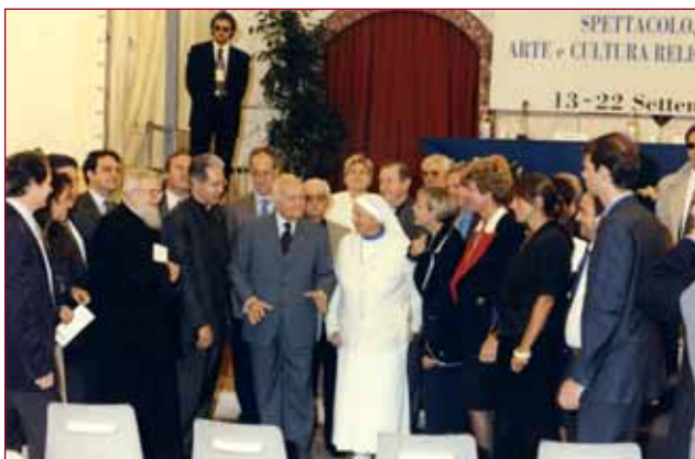
On. Luigi Scalfaro con i membri della Pia Unione. Grande devoto della Madonna celebrava qui al Santuario i sabati mariani ed era solito recitarvi il rosario

Alla fine d'aprile 1978 dal suo viaggio missionario internazionale, faceva sosta a Roma la venerata statua della Madonna di Fatima, fatta segno di grandi manifestazioni popolari e suscitatrice d'intense emozioni e di mai perdute speranze. Prima di iniziare uno spettacoloso pellegrinaggio al Santuario romano del Divino Amore, il Cardinal Vicario Poletti e l'On. Scalfaro pronunciarono parole di esortazione. In occasione della morte del Senatore Oscar Luigi Scalfaro, schivo ed assiduo frequentatore del nostro Santuario, ne ricordiamo alcuni passaggi a testimonianza dell'amore filiale a Maria che ha palesato in più occasioni.