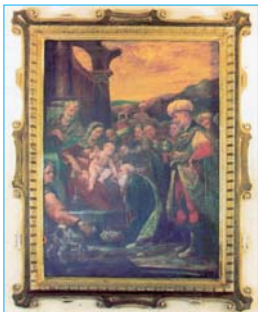
Madonna dei Re Magi

condizione di servo e divenendo simile agli uomini”.