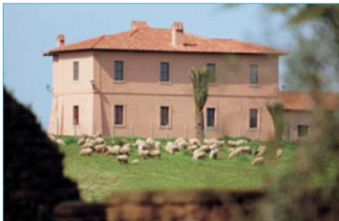
Casale S. Benedetto per la solidarietà vicino al Santuario