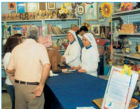
Sala dei ricordi e degli ex-voto della mostra missionaria

Ore 16.00 A conclusione S. Messa presso il Nuovo Santuario per le vittime della strada e Sicurezza Stradale.