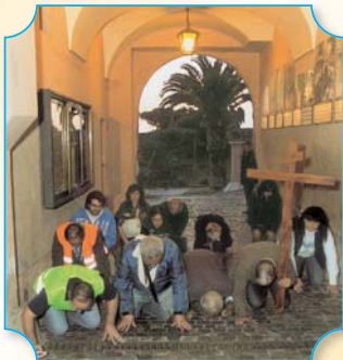
Gruppo "Corsi di Vita Cristiana"