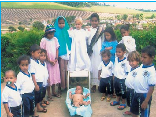
Dalle Missioni del Divino Amore in Brasile