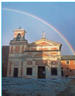
Antico Santuario. Insolita grandinata e... ritorno dell'Arcobaleno