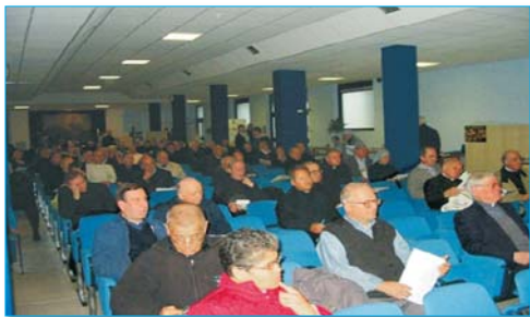
Un aspetto della sala delle conferenze.

recano al santuario sono immagine della chiesa pellegrinante, che va verso un comune obiettivo: il desiderio di vedere il volto del divino.