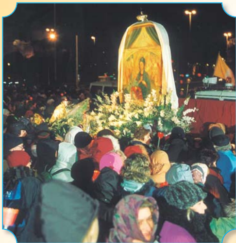
Quest'anno i pellegrini giunti a un km dal Santuario troveranno, all'incrocio con Via Don Umberto Terenzi, un monumento che lo ricorda e sembra dare il benvenuto nel "suo" Santuario

Il simbolismo del pellegrinaggio appare evidente con i suoi segni; l'Immagine della