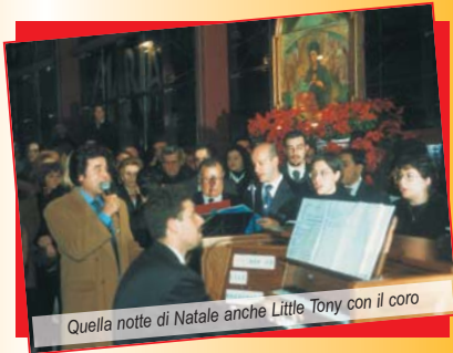
Quella notte di Natale anche Little Tony con il coro