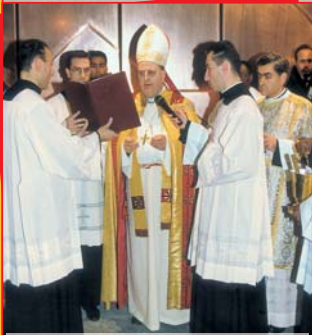
Mons. Luigi Moretti Benedice le porte del nuovo Santuario